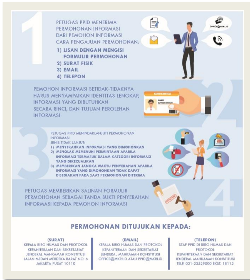
Pengumuman Prosedur Permohonan Informasi di Laman MKRI

Cara mengajukan permohonan informasi publik adalah sebagai berikut.