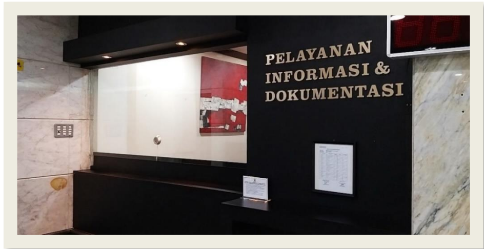
Ruang Pelayanan Informasi dan Dokumentasi Mahkamah Konstitusi